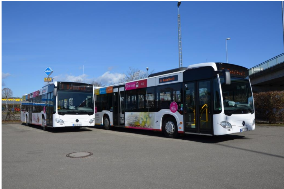
Abbildung 1: Corporate-Design am Fahrzeug

Die Fahrzeuge sind im Stadtbus-Design zu gestalten (siehe Abbildung 1). Folienungspläne können vom Verkehrsunternehmen im Falle einer eigenwirtschaftlichen Genehmigung von den Stadtwerken Radolfzell GmbH angefordert werden.